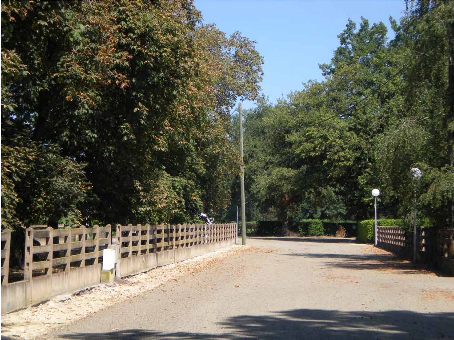
Rue Patt Kalley