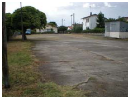
ancienne place Baquarailhon

L'ancien terrain vague, situé au cœur de Barbe d'Or, fera place à un espace de vie à la fois agréable et ludique : chaussée existante démolie pour être remplacée par un cheminement éclairé pour les piétons et deux roues, site entièrement végétalisé et arboré, mise en place d'un nouveau mobilier de détente (bancs, terrasse...), pratique (garage de stockage pour les fêtes de quartier) et sportif (terrain de pétanque), 7 nouvelles places de parking. Les travaux ont commencé fin octobre et seront inaugurés février 2011.