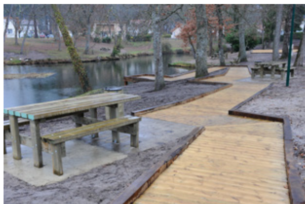
Aménagement inauguré le 19 février 2011