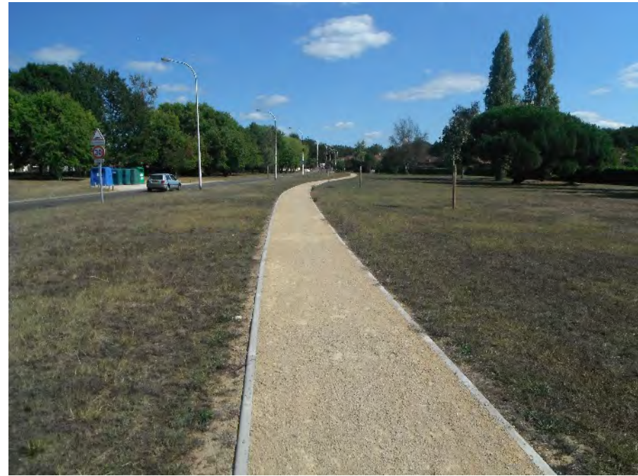
Création d'un cheminement piéton