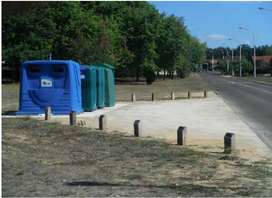
Aménagement de l'aire de collecte