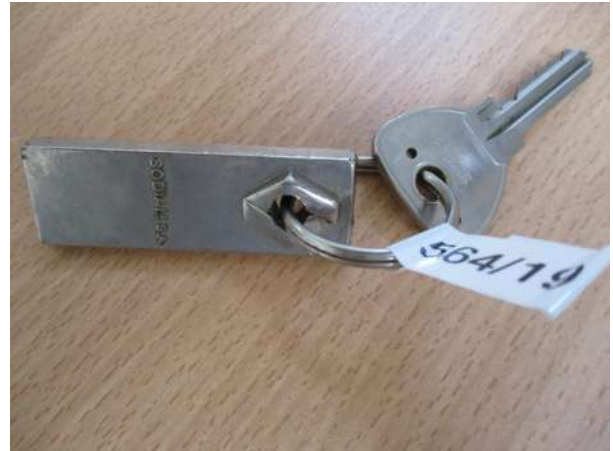
Réf. : Clé 564 /2019