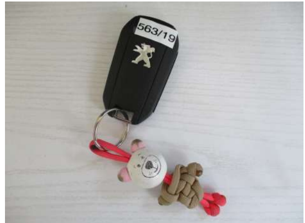
Réf. : Clé 563 /2019