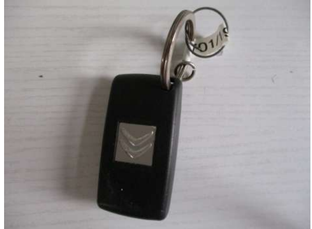
Réf. : Clé 701/2019 FETES MADELEINE