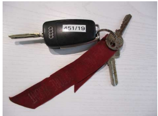
Réf. : Clé 451 /2019