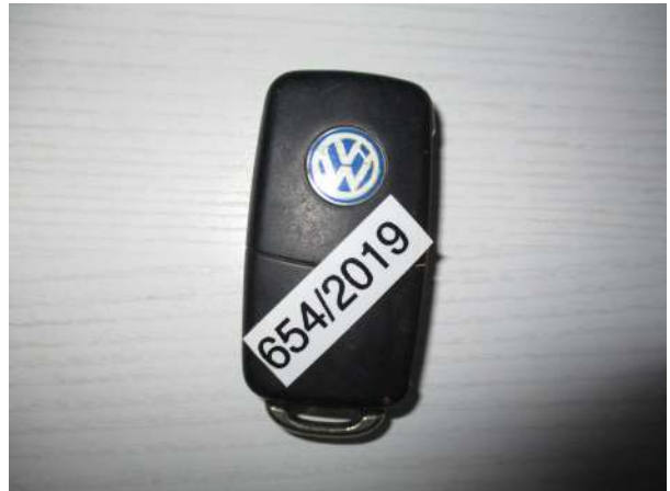
Réf. : Clé 654/2019 FETES MADELEINE