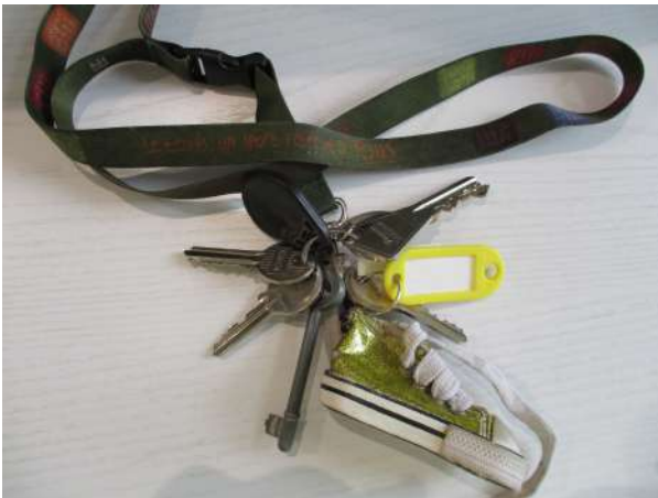
Réf. : Clé 504 /2019