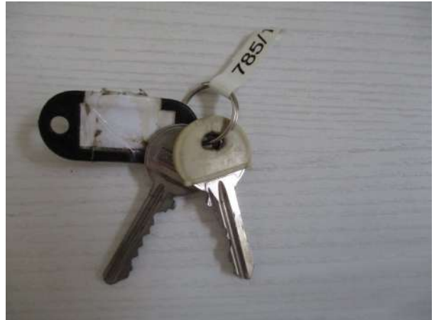
Réf. : Clé 785/2019 FETES MADELEINE