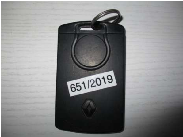
Réf. : Clé 651/2019 FETES MADELEINE