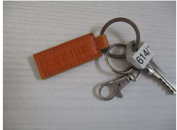
Réf. : Clé 614 /2019 FETES MADELEINE