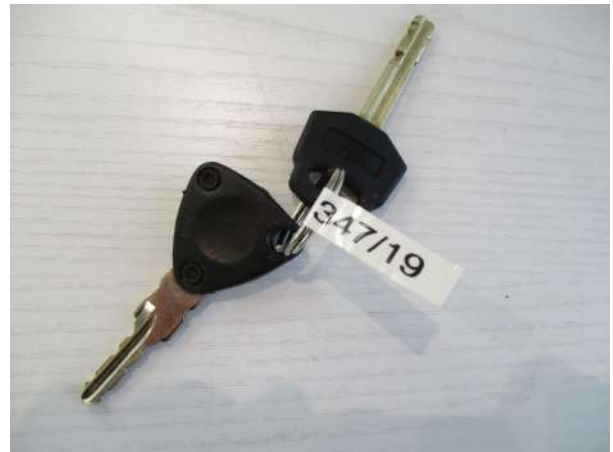
Réf. : Clé 347 /201