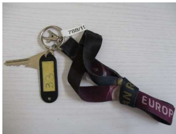
Réf. : Clé 788/2019 FETES MADELEINE