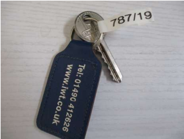
Réf. : Clé 787/2019 FETES MADELEINE