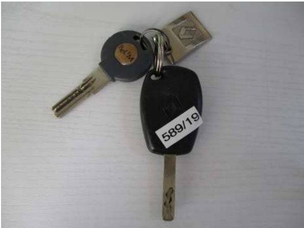
Réf. : Clé 589 /2019