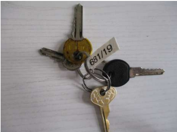
Réf. : Clé 681/2019 FETES MADELEINE