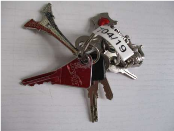
Réf. : Clé 704/2019 FETES MADELEINE