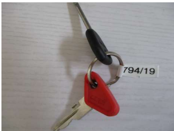
Réf. : Clé 794/2019 FETES MADELEINE