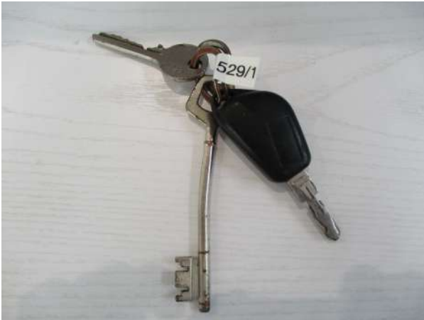
Réf. : Clé 529 /2019