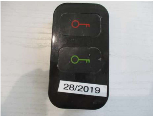
Réf. : Clé 28/2019