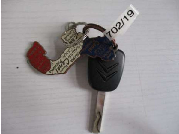
Réf. : Clé 702/2019 FETES MADELEINE