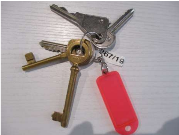
Réf. : Clé 367 /201