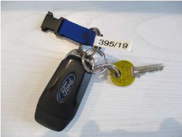
Réf. : Clé 395 /201