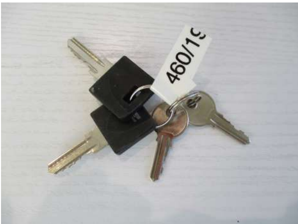
Réf. : Clé 460 /2019