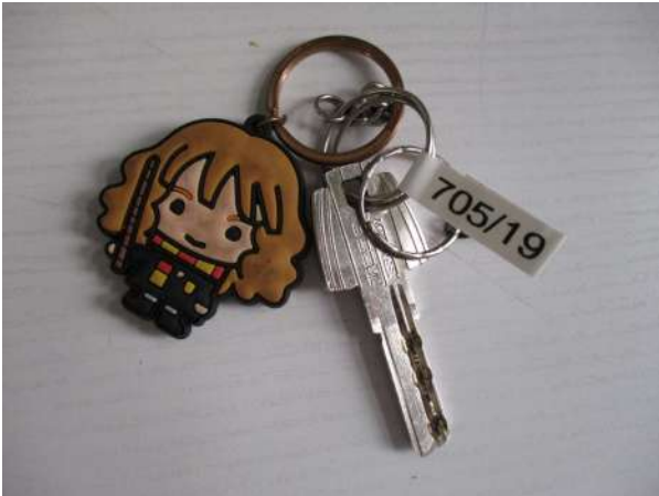
Réf. : Clé 705/2019 FETES MADELEINE