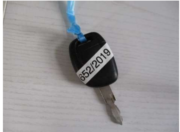
Réf. : Clé 652/2019 FETES MADELEINE