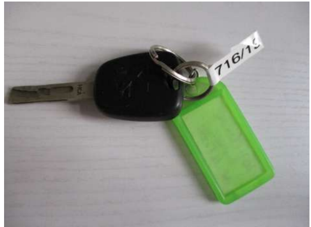
Réf. : Clé 716/2019 FETES MADELEINE