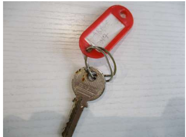
Réf. : Clé 504 /2019