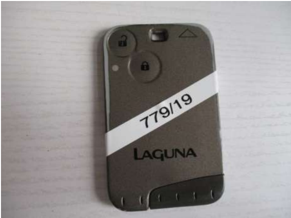
Réf. : Clé 779/2019 FETES MADELEINE