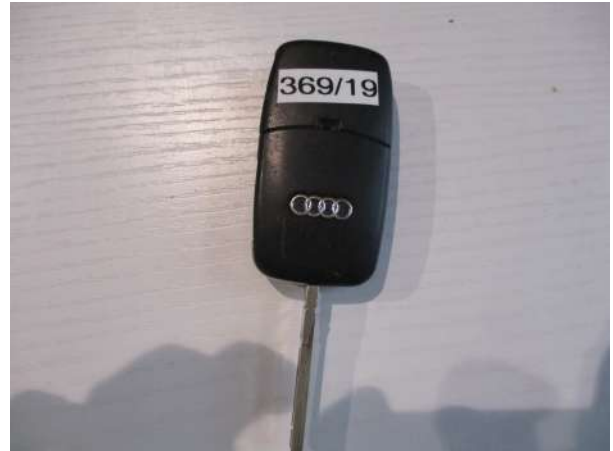
Réf. : Clé 369 /2019