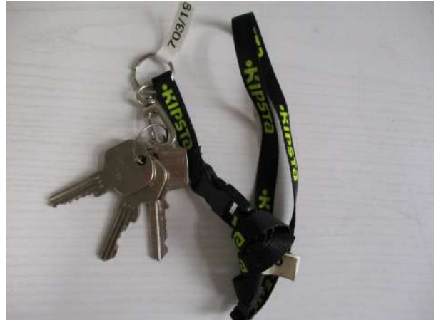
Réf. : Clé 703/2019 FETES MADELEINE