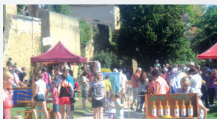
La Médiévale, début septembre