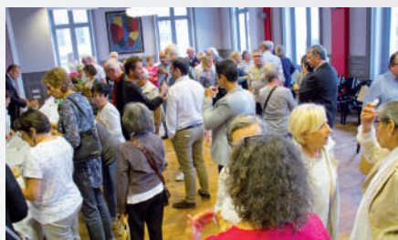
Accueil des nouveaux arrivants une fois par an