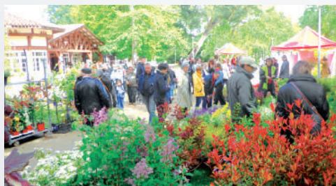
La fête des jardins, dernier dimanche d'avril