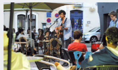
Aménagements de la Place Pitrac