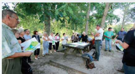
Présentation d'aménagements aux riverains