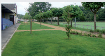
Abords du terrain du Pégly sécurisés