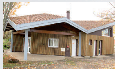
Nouvel habillage extérieur de la salle Georges Brassens

mon quartier notre cadre de vie décidons ensemble