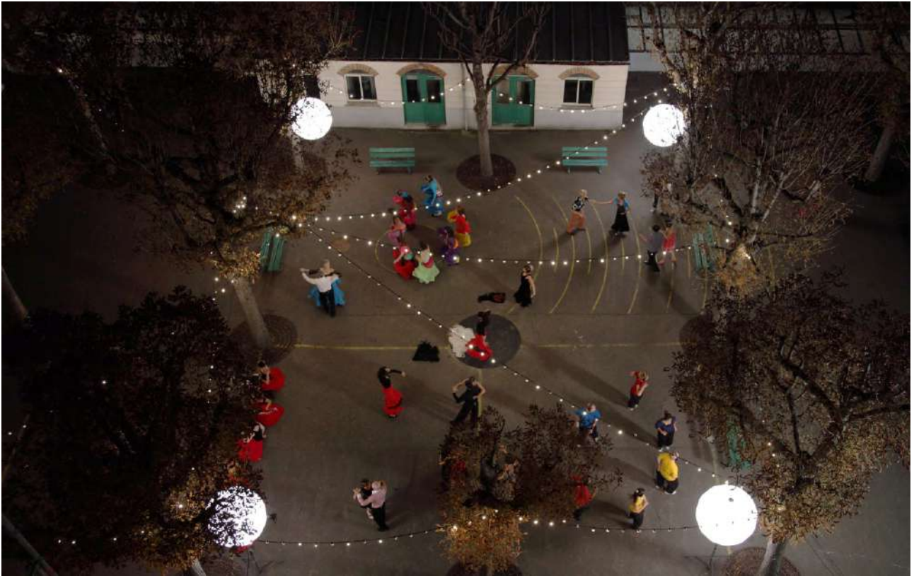
Melanie Manchot Dance (All Night, Paris) 2011 Video HD, 12'37"