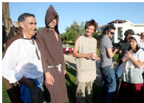
Thème médiéval retenu