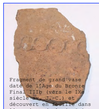
Fragment de grand vase daté de l'Age du Bronze Final IIIb (vers le IX e siècle av. J.-C.) et découvert en fouille dans l'enceinte du lycée Saint-

Enfin, à l'époque contemporaine intervient la construction du Lycée Saint-Vincent. »