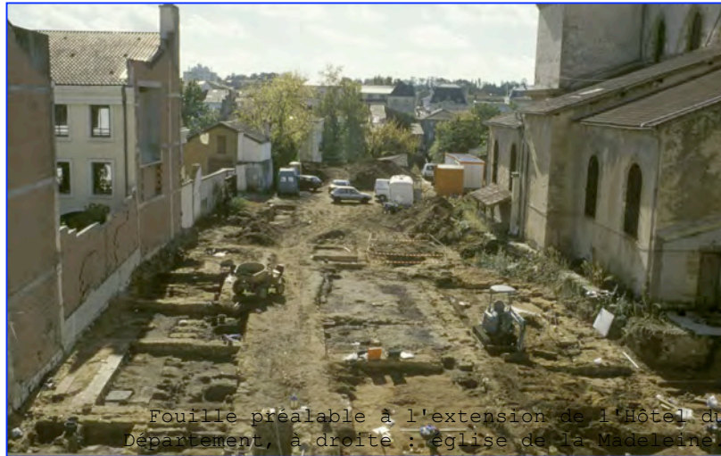
Fouille préalable à l'extension de l'Hôtel du Département, à droite : église de la Madeleine (responsable : Jacques PONS, AFAN, 2001).

Le rapport de fouilles de l'extension du Conseil général des Landes par C. Hanusse et D. Roux mentionne la présence d'une petite fosse dépotoir contenant des fragments d'amphores datés de la charnière du premier siècle avant J.-C. et du premier siècle après J.-C.