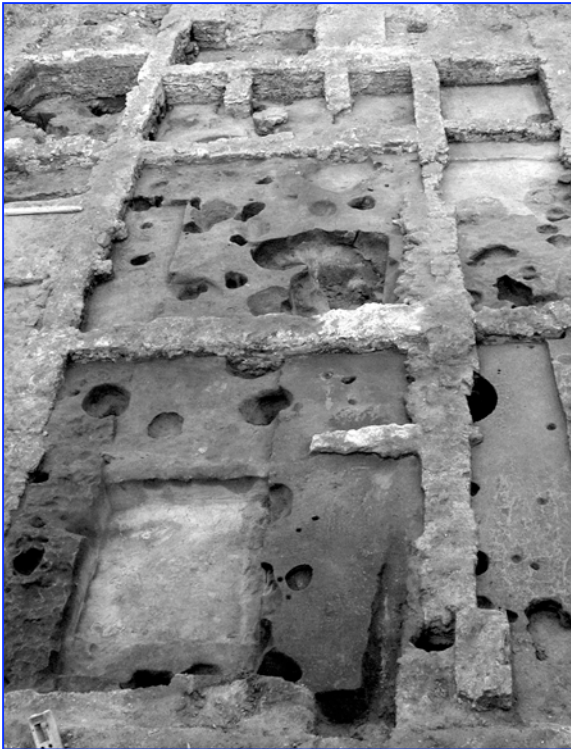
Fouille préalable à l'aménagement du parking de la Madeleine (responsable : société HADES, 2003).

Sur cet ensemble de vestiges montois, quelques pièces signalent le passage de chasseurs sans que les époques soient vraiment identifiables.