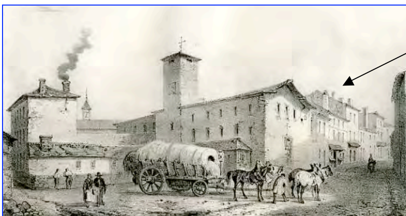
Bâtiments où les Barnabites tenaient leur collège (à l'emplacement de l'actuel hôtel de ville et de la place du Général-Leclerc)

philosophie (les classes de grammaire pouvant être tenues par des séculiers) et faire le catéchisme. En contrepartie la ville devait leur fournir un local meublé avec une chapelle et une rente annuelle de 2400 livres.