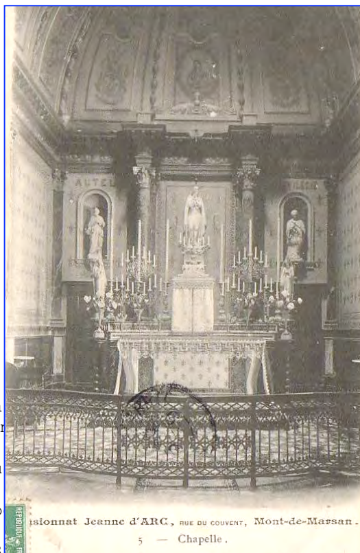
Missionnat Jeanne d'ARC, RUE DU COUVENT, MONT-DE-MARSAN. 5 — Chapelle.

C'étaient surtout les filles de bonnes familles qui fréquentaient ces écoles où était dispensée une éducation propre à former le caractère de la future femme obéissante à son époux et capable de